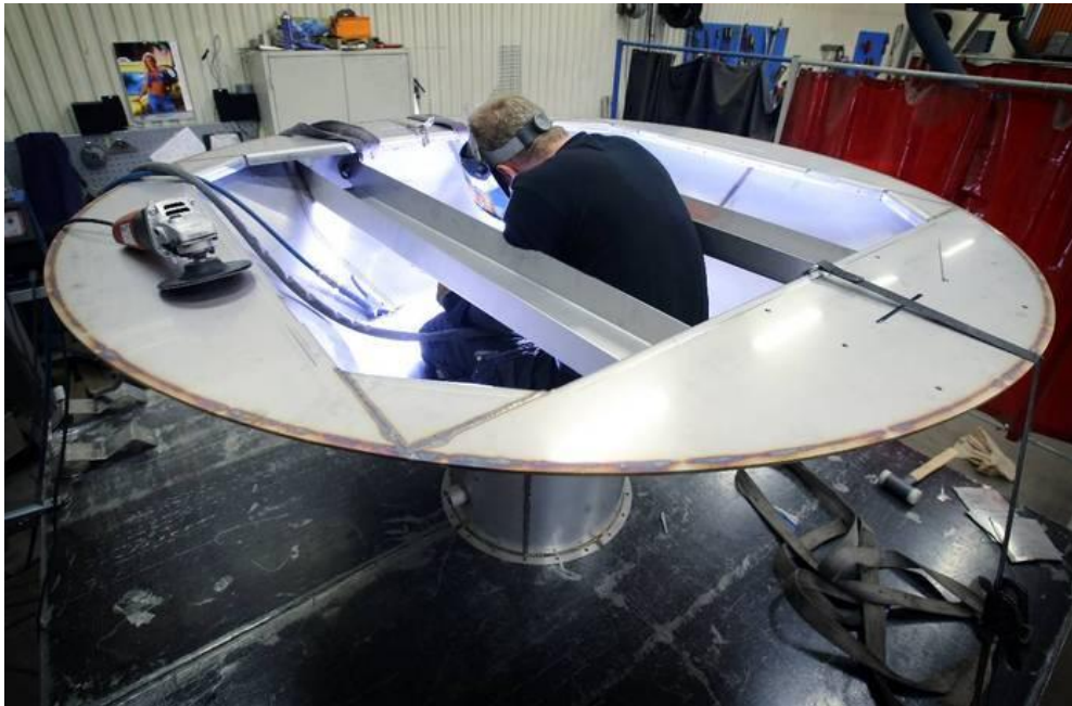
Det är olika storlekar och modeller att arbeta med.