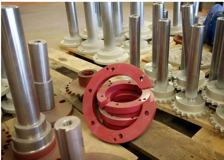
En del arbeten läggs ut på lokala företag, som svarvning av axlar till exempel.